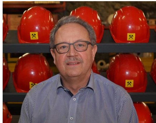
Vizepräsident: Markus Straub